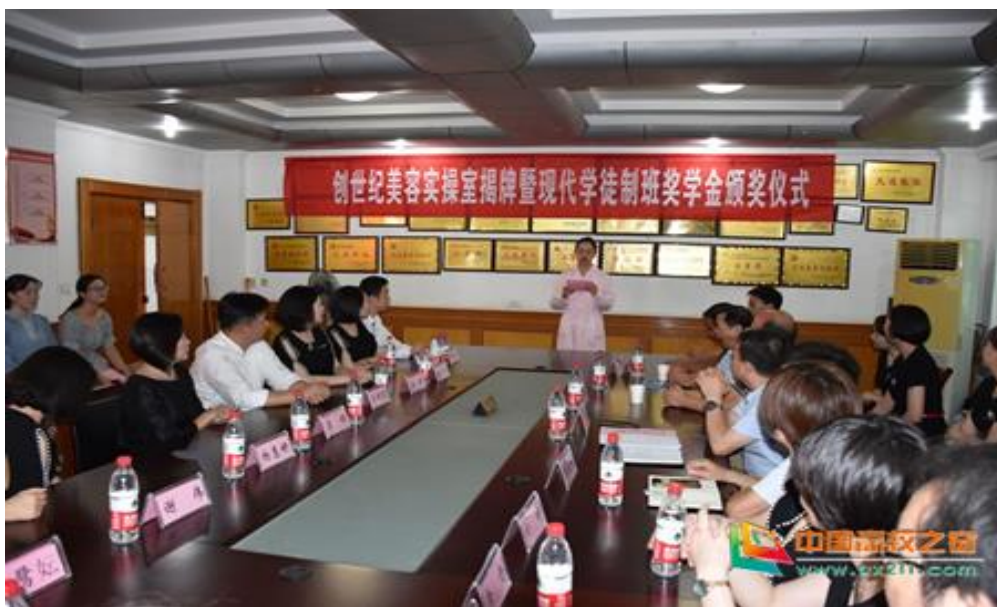
图 2-1 鄂州职业大学创世纪美容实操室揭牌仪式现场