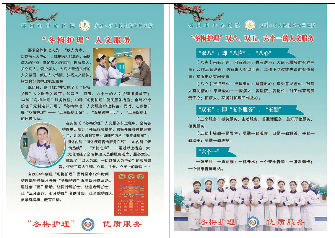
图 2-6 “冬梅护理”人文服务

第二、通过聘请医院专家、操作能手来学校与校内专职教师合作，开展人文讲座、法律法规讲座；学生的课余生活丰富多彩，通过开展社区服务活动、礼仪比赛、专业知识比赛、专业操作技能比赛、户外素质拓展活动、新生军事训练、志愿服务活动提升学生综合素质，学生的爱心、耐心、细心、责任心和诚信品质、敬业精神、守法意识等显著提升；积极践行养成教育，加强学生学习和可持续发展能力培养，全面提高学生综合素质。