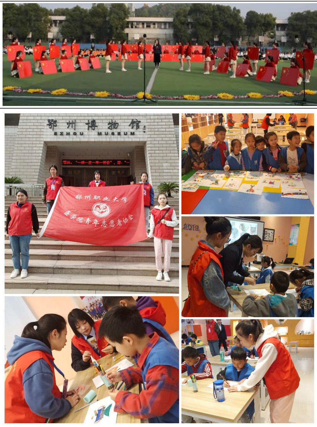
图 2-7 丰富多彩的校园生活

老人、关爱残疾儿童、志愿服务活动、传承红色基因等。积极开展形式多样素质拓展、体育活动及校园文化活动，培育浓厚的文化氛围，让青春在活动中张扬、让人格在活动中升华。