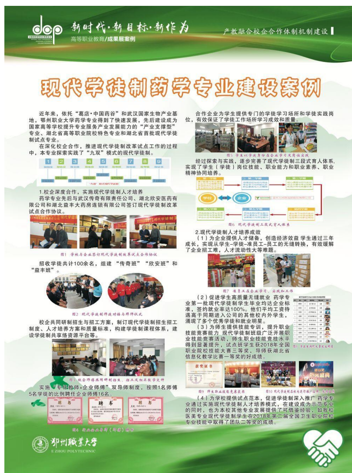
图 2-3 现代学徒制建设成果展示