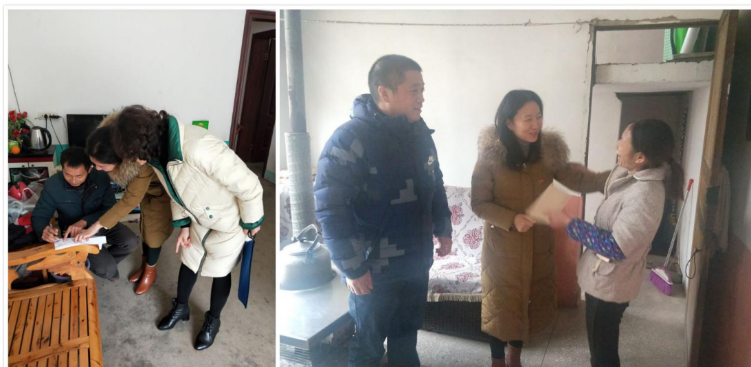
（入户走访贫困生家庭）

我校为打赢教育脱贫攻坚战，让建档立卡贫困家庭学生及其家长，了解党和国家坚定教育助学脱贫工作的决心和帮扶力度，知晓国家教育助学脱贫的各项资助政策，让家长了解到孩子在校受助情况、学习情况、生活情况，增强建档立卡贫困家庭的育人意识和脱贫信心，校学生资助中心 2019 年 12 月 4 日—9 日开展了入户走访慰问活动，进村入户精准识别，扎实推进教育扶贫。此次活动进一步提高了教书育人的积极性，融洽了家校关系，加深了师生情谊；有利于树立教育的良好形象，有利于提高学校学生资助工作的精准性和针对性，进一步提升我校资助工作的育人成效。