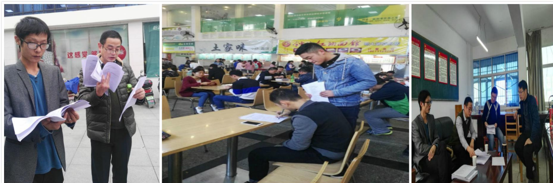
随机抽查学生做问卷调查

认真落实国家资助政策，做好资助政策宣传。通过问卷调查、座谈等形式了解学生对资助政策知晓度，与学院加强联系收集资助工作反馈意见，扎实做好贫困生认定、奖助学金评选工作。