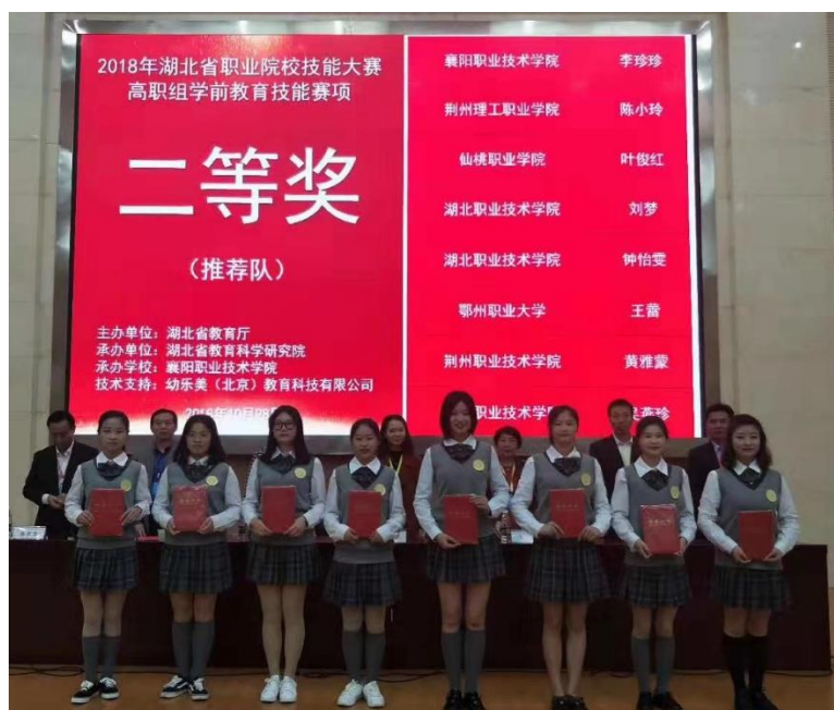
2018 年湖北省职业院校技能大赛