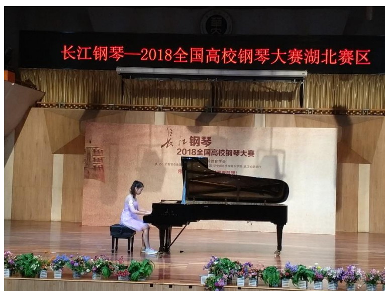
长江钢琴—2018 年全国高校钢琴大赛