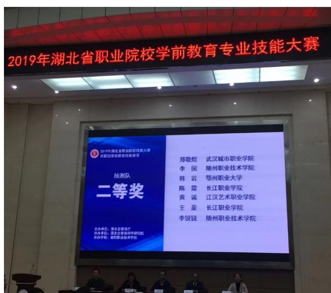
2019 年湖北省职业院校技能大赛