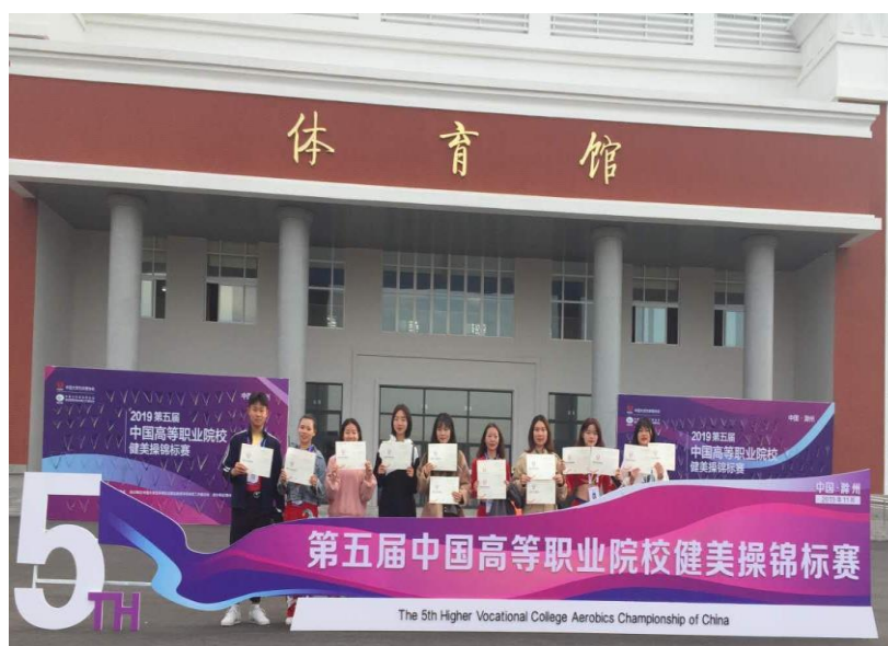
第五届中国高等职业院校健美操锦标赛